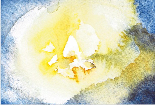
Touch the flame /2020 /100×148mm /Watercolor on paper